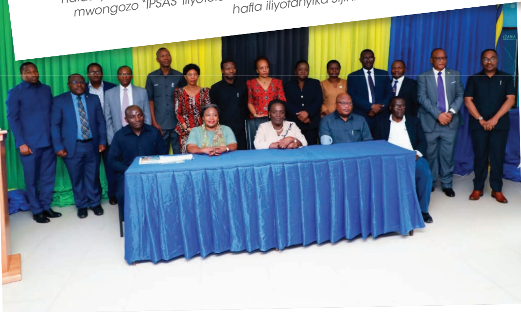
Novemba 16, 2021; Waziri wa Elimu, Sayansi na Teknolojia, Prof. Joyce Ndalichako (waliokaa katikati) akiwa katika picha ya pamoja na Wakuu wa Taasisi zilizo chini ya Wizara hiyo wakati wakati wa ufunguzi wa kikao kazi cha Maafisa Habari, Elimu na Mawasiliano wa Wakala na Taasisi zilizo chini ya Wizara hiyo Mkoani Morogoro.