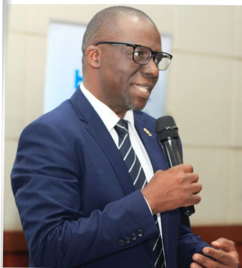
Oktoba 26, 2023, Dar es salaam: Mkurugenzi wa HESLB Abdul-Razaq Badru akizungumza na wahariri wa vyombo vya Habari (hawapo pichani) katika mkutano uliofanyika katika ukumbi wa PSSSF Golden Jubilee.